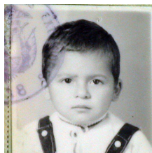
Photo mystère, un membre de l'association il y a quelques années, devinez qui est-ce...

Envoyez votre réponse avant le 20 juillet minuit à : lejournaldesadoptes@gmail.com Deux places de ciné à gagner. Tirage au sort parmi les bonnes réponses